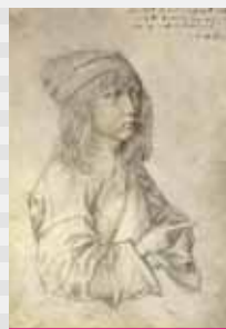
Albrecht Dürer: Selbstporträt mit 13 Jahren